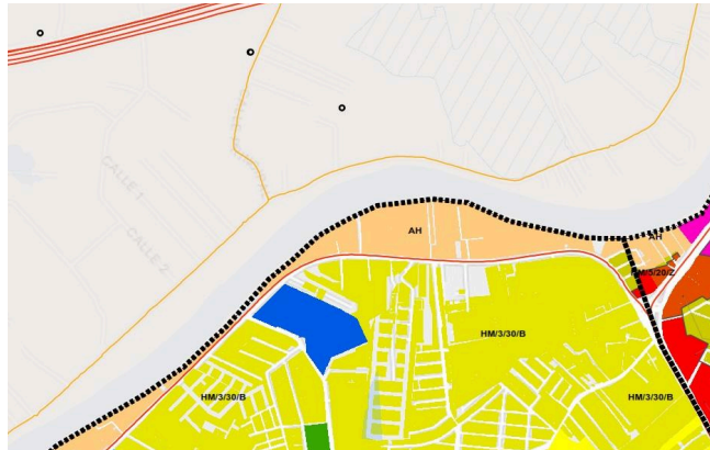
Imagen 3 , Del plano de zonificación secundaria ZS C2, de la ciudad de Villahermosa.