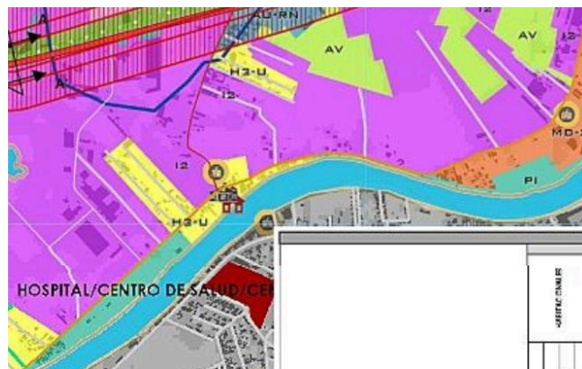
Imagen 4 , Del plano Política de Desarrollo Urbano P27.