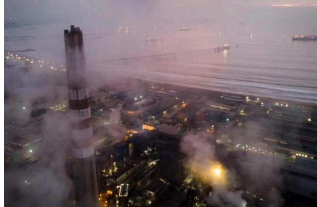
Imagen 1 , Instalaciones industriales de Quintero y Puchuncaví, costa de Valparaíso, República de Chile.